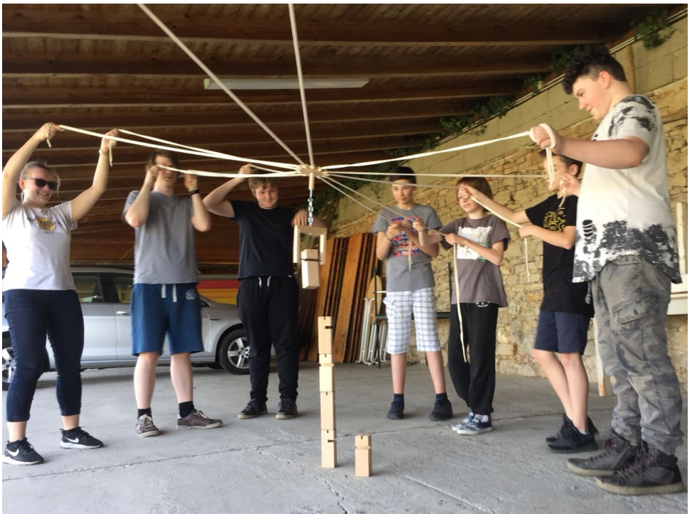
Unsere Konfis bauen gemeinsam den „Fröbelturm“

Das Konfiwochenende ist immer eine bunte Mischung aus Kreativem, Spielen, Singen und Reden über den Glauben an Gott. Unser Thema war wieder: „Der Heilige Geist - oder: wie wir Gott erleben können.“