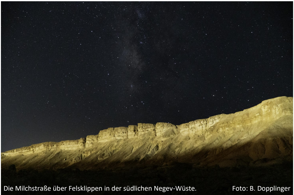
Die Milchstraße über Felsklippen in der südlichen Negev-Wüste.