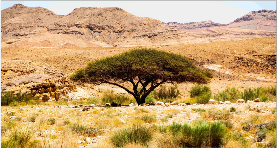
Ein schattenspendender Baum in der Negev-Wüste im Süden Israels.